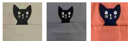
01 ベージュ 02 グレー 03 ブラウン