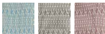
01 ブルー 02 グレー 03 ブラウン