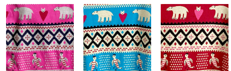
01 ピンク 02 ブルー 03 レッド