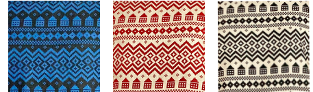
01 ブルー 02 レッド 03 ブラック