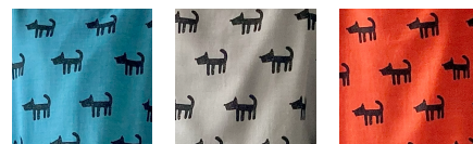
01 ブルー 02 グレー 03 オレンジ