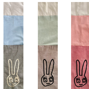
01 ブルー 02 カーキ 03 レッド