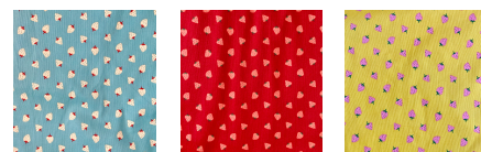
01 ブルー 02 レッド 03 イエロー