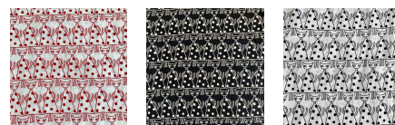
01 レッド 02 ブラック 03 ホワイト