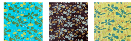
01 ブルー 02 ブラック 03 イエロー